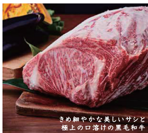
きめ細やかな美しいサシと 極上の口溶けの黒毛和牛