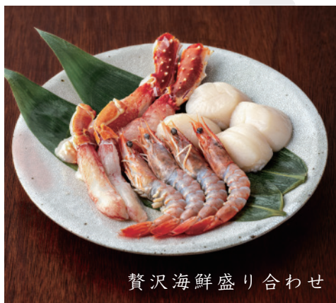
贅沢海鮮盛り合わせ