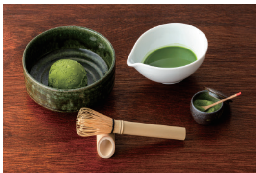
抹茶アフオガード

抹茶の上品な香りと やさしい甘さが楽しめる水羊羹です。 練乳をかけてお召し上がりください。