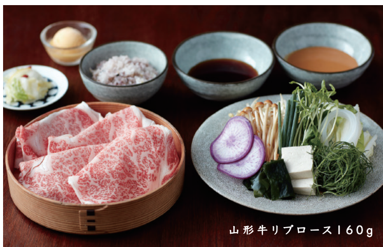
山形牛リブローズ160g

牛肉はA4ランク以上の良質な国産の霜降り牛を 三種類ご用意しております。お好きなお肉をお選びください。