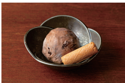
季節のアイスクリーム