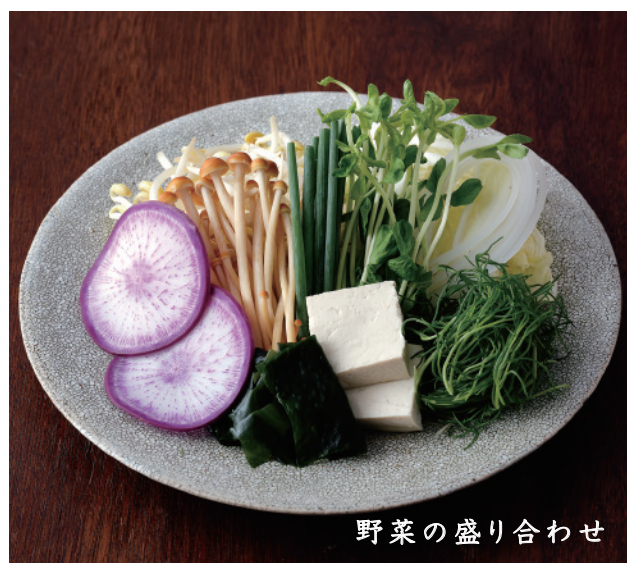
野菜の盛り合わせ