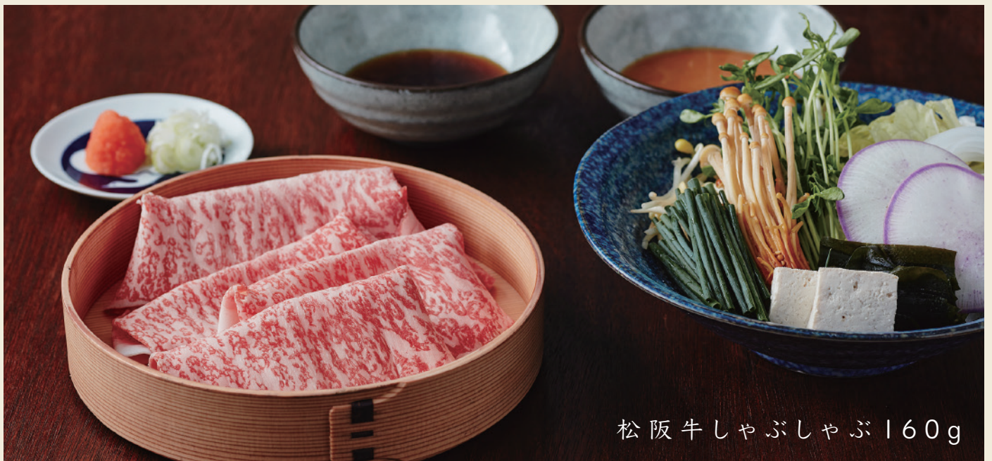
松阪牛しゃぶしゃぶ160g