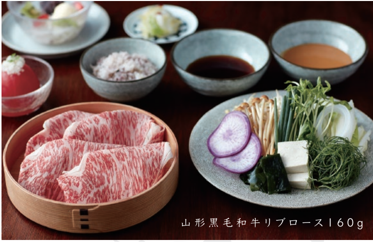
山形黒毛和牛リブロース160g

牛肉はA4ランク以上の良質な国産の黒毛和牛を 三種類ご用意しております。好きなお肉をお選びください。