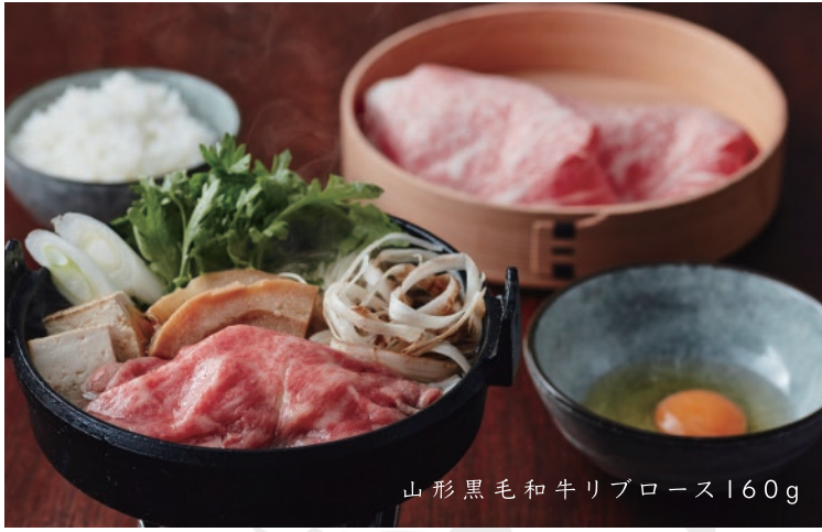
山形黒毛和牛リブローズ160g

牛肉はA4ランク以上の良質な国産の黒毛和牛を二種類 ご用意しております。好きなお肉をお選びください。