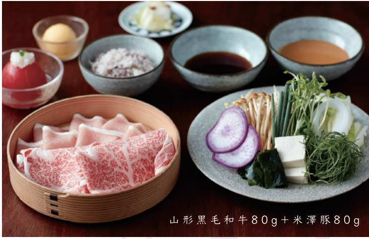
山形黒毛和牛80g+米澤豚80g

牛肉はA4ランク以上の良質な国産の黒毛和牛のリブロースを三種類ご用意しております。お好きなお肉をお選びください。豚肉はすべて「米澤豚一番育ち」を使用しております。