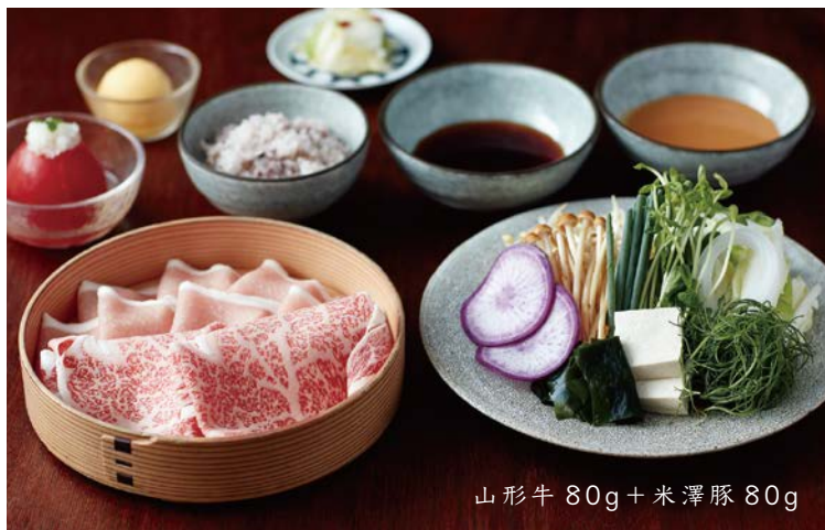
山形牛 80g + 米澤豚 80g

牛肉はA4ランク以上の良質な黒毛和牛のリブロースを 三種類ご用意しております。お好きなお肉をお選びください。 豚肉はすべて「米澤豚一番育ち」を使用しております。