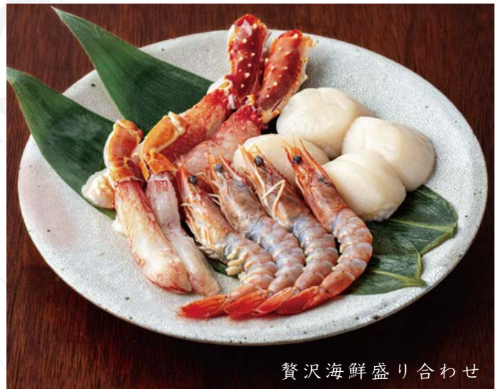
贅沢海鮮盛り合わせ