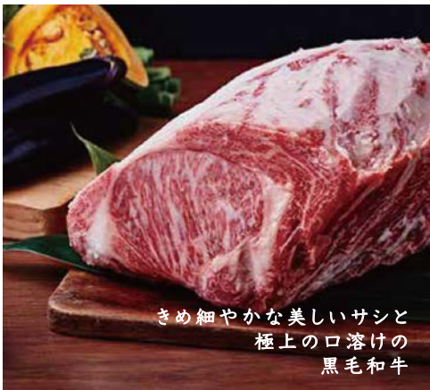
きめ細やかな美しいサシと 極上の口溶けの 黒毛和牛