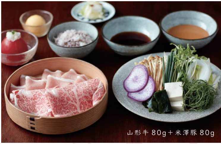
山形牛 80g + 米澤豚 80g

牛肉はA4ランク以上の良質な黒毛和牛のリブロースを三種類ご用意しております。お好きなお肉をお選びください。豚肉はすべて「米澤豚一番育ち」を使用しております。