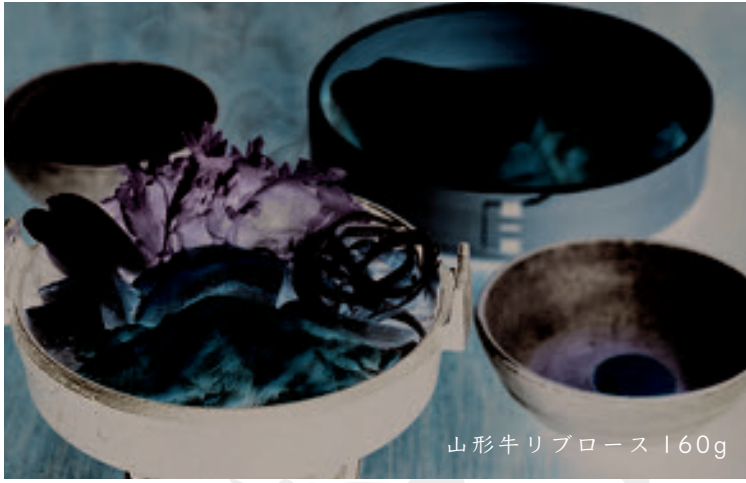
山形牛リブコース 160g

牛肉はA4ランク以上の良質な国産の黒毛和牛を二種類 ご用意しております。好きなお肉をお選びください。